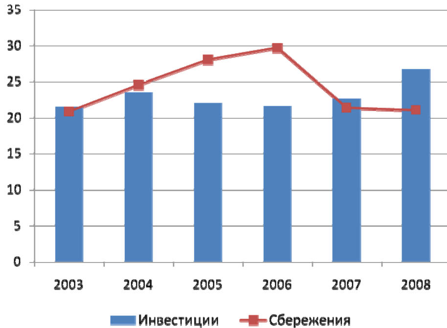
Инвестиции и сбережения, в % от ВВП